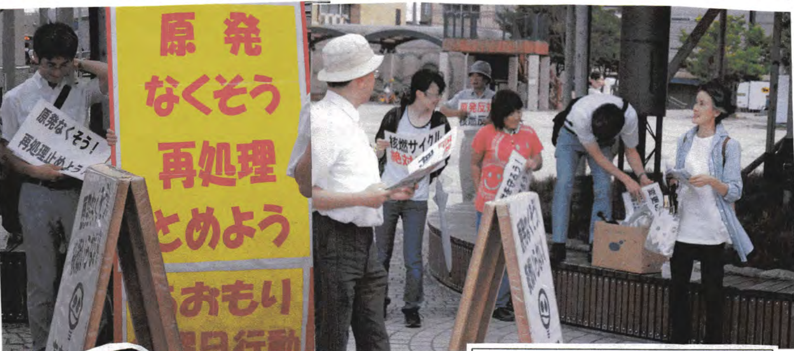
7/18 大マグロック前日、 横浜市からの女性も青森金曜行動に合流