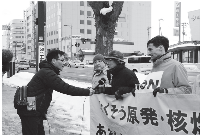
韓国のメディアも取材にやってきた