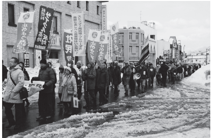
のぼり旗を掲げて中心街をデモ行進