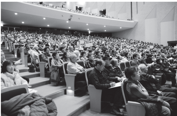
大ホールに 1300 名